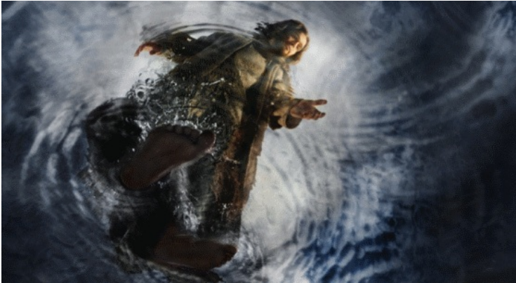
Fra TV-serien The Bible (2013)

Og på samme måde står I konfirmander lidt endnu inde i båden - men livet kalder på jer og siger "kom og vær med - kom herud!"