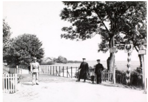
Toldere ved Foldingbro

Lokalt er der f. eks. sønderjysk kaffebord på Kratskellet den 15. marts.