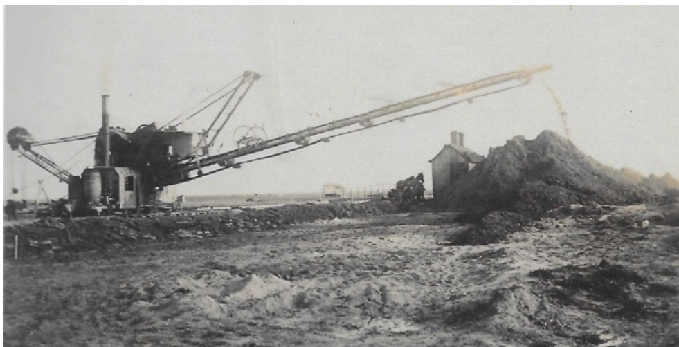
En af gravemaskinerne (med spande) der blev brugt ved arbejdet med Ribe diget 1911-1914.

Arbejdet med Ribe diget blev påbegyndt i 1911 og arbejdet med Darum - Tjæreborg diget blev påbegyndt i 1926. De to diger mødes ved sidediget ved Thors Banke.