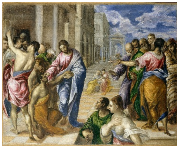
Jesus helbreder den blinde mand ved Jeriko, maleri af El Greco, ca. 1573.