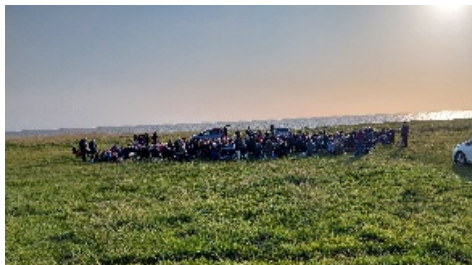
Digesang den 25. maj 2023

Udover, at der har været Digesang (velbesøgt!) i løbet af sommeren, var vores første "aktivitet" efter sommerferien at afholde den årlige Digegudstjeneste.