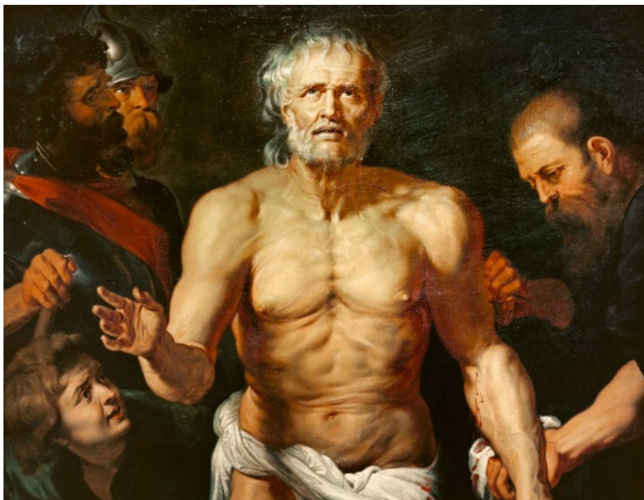
"Senecas død", Peter Paul Rubens, 1614.