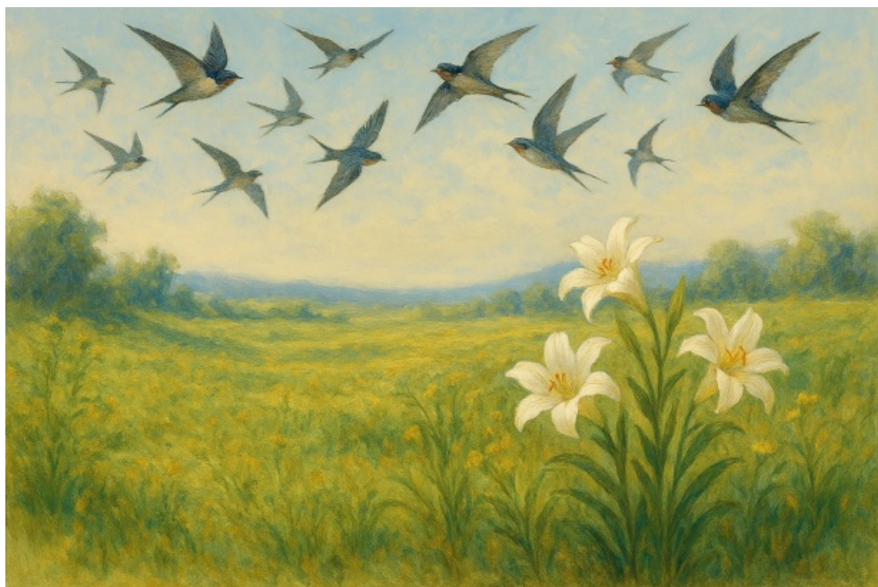
AI -genereret billede